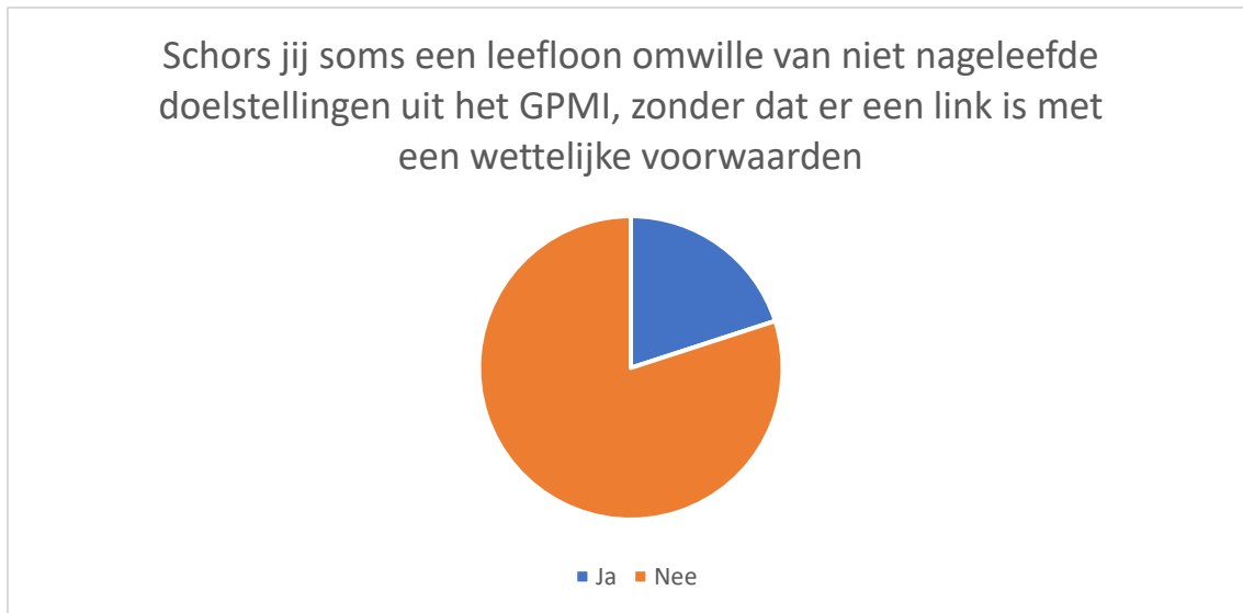
Figuur 2: Percentage respondentent dat aangeeft soms een leefloon te schorsen omwille van niet nageleefde doelstellingen uit het GPMI, zonder dat er een link is met een wettelijke voorwaarde.

Uiteindelijk geeft ruim 20 procent van de respondenten aan dat ze sancties opleggen omwille van niet nageleefde doelstellingen uit het GPMI, zonder dat er een link is met een wettelijke voorwaarde