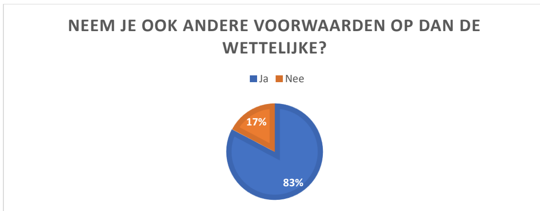
Figuur 2: Percentage respondenten dat aangeeft andere voorwaarden op te nemen dan de wettelijke voorwaarden die aan het leefloon gekoppeld zijn

92 procent van hen stelt mee GPMI-contracten op. Nochtans zegt 291 respondenten (60 procent) zich daar soms onzeker bij te voelen. Redenen daarvoor zijn (figuur 1): niet weten welke doelstellingen afdwingbaar zijn (124 respondenten), moeite hebben met begrijpelijke taal te hanteren (120 respondenten) en het feit dat er erg delicate kwesties op papier gezet worden (118 respondenten). Bijna 1 op 5 (17.7 procent) respondenten geeft ook aan methodisch noch inhoudelijk ondersteuning te krijgen bij het opstellen van GPMI's.