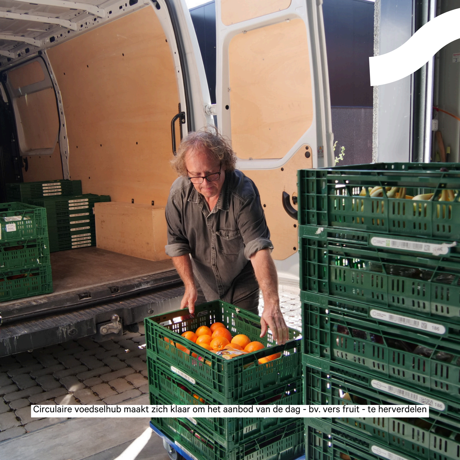
Circulaire voedselhub maakt zich klaar om het aanbod van de dag - bv. vers fruit - te herverdelen